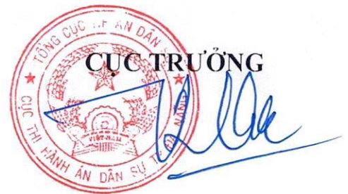
Trần Phước Thu