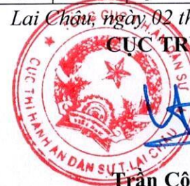
Trần Công Hường