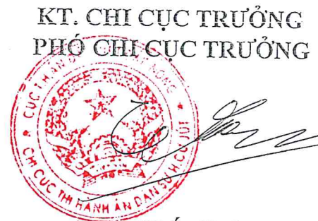
Đặng Khắc Thủy